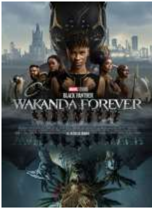
Action - 2h42

Réalisé par Ryan Coogler Avec Letitia Wright, Angela Bassett, Danai Gurira