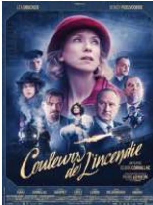
Historique - Drame - 2h16

Réalisé par Clovis Cornillac Avec Léa Drucker, Benoît Poelvoorde, Alice Isaaz