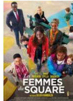
Comédie - 1h45

Réalisé par Julien Rambaldi Avec Eye Haïdara, Ahmed Sylla, Léa Drucker