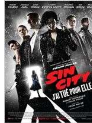
Action - Thriller - 1h42