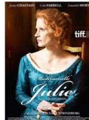
Drame - 2h13

1890, Irlande. Tandis que tout le monde célèbre la nuit des feux de la Saint Jean, Mademoiselle Julie et John, le valet de son père, se charment, se jaugent et se manipulent sous les yeux de Kathleen, la cuisinière du baron, jeune fiancée de John. Ce dernier convoite depuis de nombreuses années la comtesse voyant en elle un moyen de monter dans l'échelle sociale.