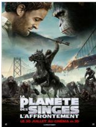
Science-fiction - Action - 2h11

Une nation de plus en plus nombreuse de singes évolués, dirigée par César, est menacée par un groupe d'humains qui a survécu au virus dévastateur qui s'est répandu dix ans plus tôt. Ils parviennent à une trêve fragile, mais de courte durée : les deux camps sont sur le point de se livrer une guerre qui décidera de l'espèce dominante sur Terre.