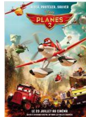
Animation - Comédie - 1h24

Dusty est au sommet de sa gloire quand il apprend que son moteur est endommagé et qu'il ne pourra peut-être plus jamais participer à une course... Il se lance alors le défi de devenir pompier du ciel. Il suivra sa formation auprès de l'élite du genre en charge de la protection du parc national de Piston Peak. Cette équipe de choc est menée par Blade Ranger, un hélicoptère vétérinaire charismatique et est composée de Dipper, une grande fan de Dusty qui en pince pour lui, Windlifter, un hélicoptère de transport lourd en charge de larguer sur les lieux de l'incendie les intrépides et déjantés parachutistes du feu. Au cours de sa lutte contre le feu, Dusty va apprendre qu'il faut beaucoup de courage et ne jamais baisser les bras pour devenir un vrai héros.