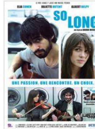
Comédie - 1h30

Joaquim est musicien, mais cela ne lui permet pas de gagner sa vie. Il a un autre talent qui lui offre une opportunité de changer son existence : travailler avec son frère et se retrouver dans le cercle très fermé des traders. Pour fêter cette nouvelle destinée, il sort... et rencontre Zoé, une jeune violoniste. Ils vont passer le reste de la nuit ensemble, à parler et à chanter. Il se retrouve devant un choix : assurer son avenir ou vivre sa passion et cet amour naissant. Mais tout ceci est-il bien réel ?