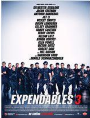
Action - Aventure - 2h07