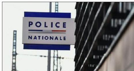
L'homme a été placé en garde à vue. Photo d'illustration LBP/Ph. BRUCHOT

Il vole six bouteilles d'alcool chez Leclerc et en fait tomber quatre