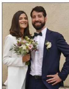
21D10 - V1