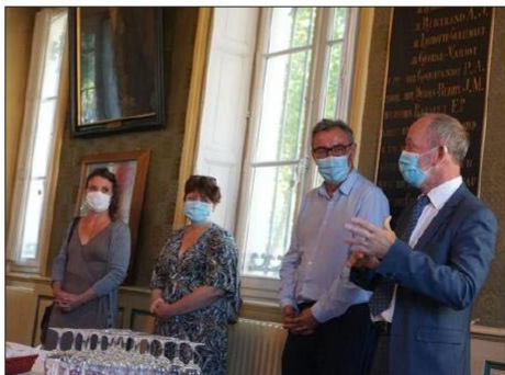
La réunion s'est tenue mercredi à la mairie.

Lors de la réunion, il a été rappelé que des aménagements seront réalisés au sein de l'école élémentaire, comme le remplacement de deux portes d'entrée, et la transfor-