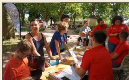
Une dizaine d'associations étaient présentes sur la quarantaine du territoire.

Samedi, la Journée des associations nolasitaines n'a pas remporté le succès escompté, avec la présence d'une dizaine d'associations. Contexte sanitaire oblige, certaines ne se sont pas senties motivées pour être présentes cette année à l'ombre des grands arbres du jardin de la mairie. Sur la quarantaine d'associations du territoire, beaucoup sont en sommeil. Mais il reste encore de multiples possibilités pour les personnes qui souhaiteraient adhérer à l'une d'elles dans les domaines du sport, de la culture et des loisirs.