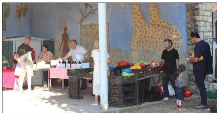
Chaque mercredi, des producteurs locaux seront présents.

Lancé par un collectif d'habitants, un marché hebdomadaire a été organisé rue La Fontaine, à Dijon, mercredi. Il rassemble des producteurs du département et prendra place chaque semaine.